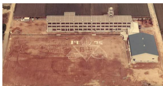
昭和50年（1975年）頃の新校舎（上安田）