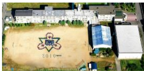
平成22年（2010年）頃の校舎（上安田）