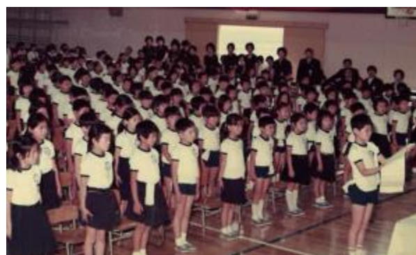
昭和50年（1975年）の100周年記念式典の様子