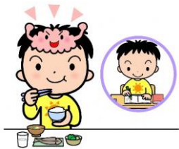
脳のスイッチオン

朝ごはんを毎日食べている人は、そうでない人に比べて、学力や運動能力が高い傾向にあることがわかっています。しっかり朝ごはんを食べて、1日を元気にスタートさせましょう。