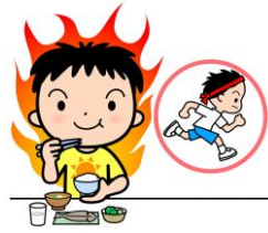
体を動かすスイッチオン