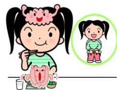
はい便をうながすスイッチオン